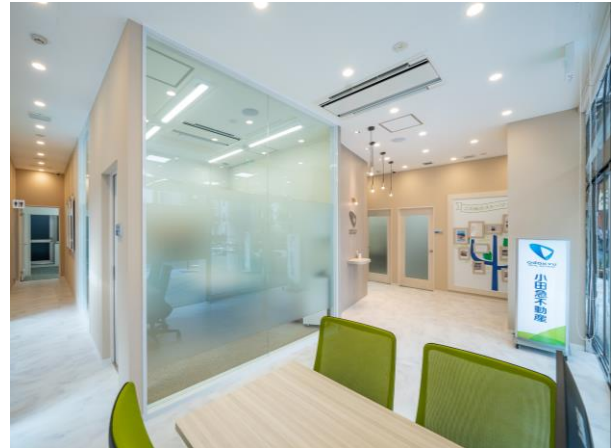
< エントランスホール >