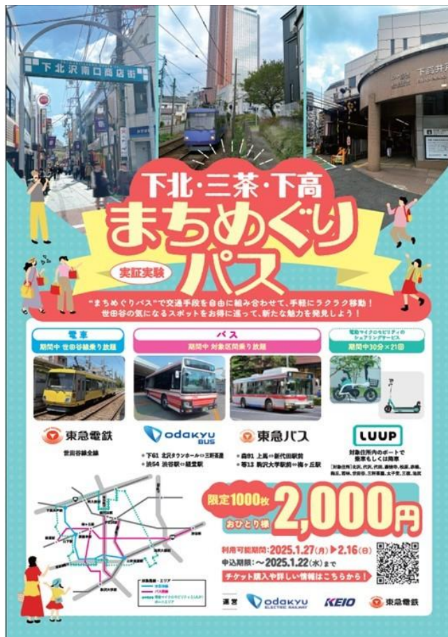
▲本デジタルパス ポスターイメージ