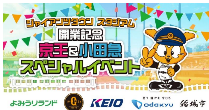
《イベントキービジュアル》

本企画を通し、5者それぞれが連携を強化することで、京王電鉄・小田急電鉄沿線ならびに稲城市の活性化および、よみうりランド・ジャイアンツタウンスタジアムへの旅客誘致を図ってまいります。