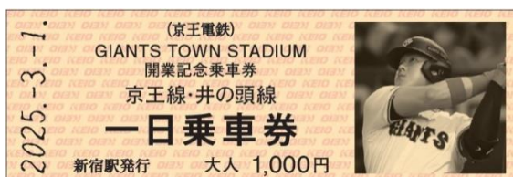
《D型硬券乗車券デザイン》