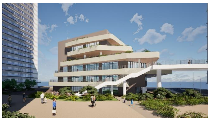
（仮称）ファミリー棟のイメージ

小田急電鉄株式会社（本社：東京都新宿区 社長：鈴木 滋）は、2025年12月19日（金）に、小田急線海老名駅西口の開発エリア「ViNA GARDENS」について、2027年春に開業予定の「（仮称）ファミリー棟」と、2028年開業予定の「（仮称）ホテル温浴棟」の新築工事計画を決定したことをお知らせします。同開発エリアは全9開発区画からなり、本2棟によりすべての開発を完了します。なお、具体的なテナント情報等は、改めてお知らせします。