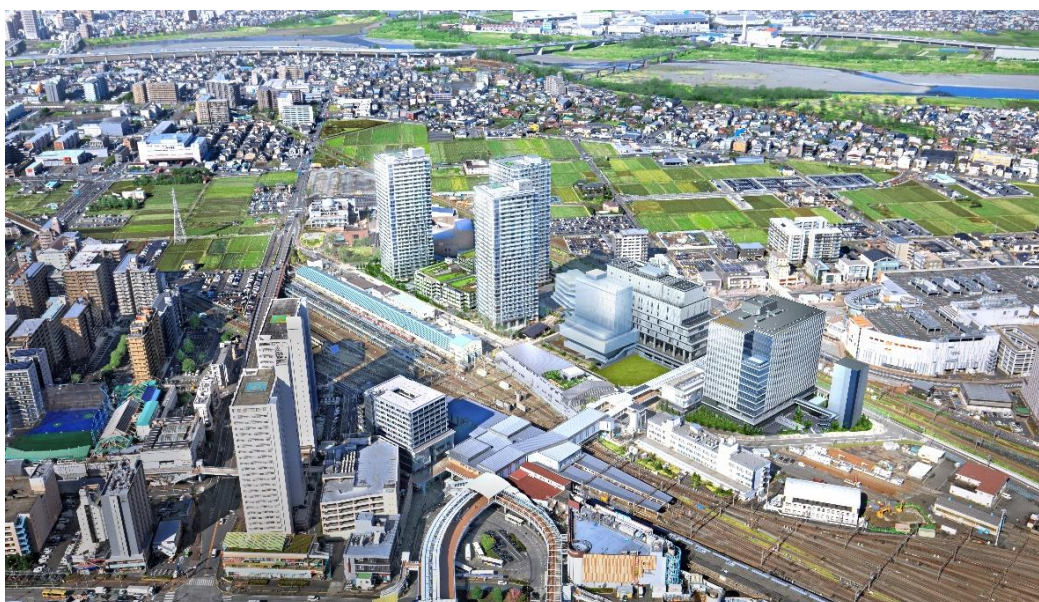
本２棟完成後の海老名駅周辺のイメージ

当社のまちづくりは、人が集い、暮らし、働き、学び、遊び、癒される“場の創出”であると捉えています。これに基づき、交通利便性と豊かな自然環境が調和する海老名の地に、「憩う」「くらす」「育む」をコンセプトとした都市空間を築き、職、住、商、学・遊、ウェルネスといった生活機能を集約することで、地域の持続的な成長を支えてまいります。