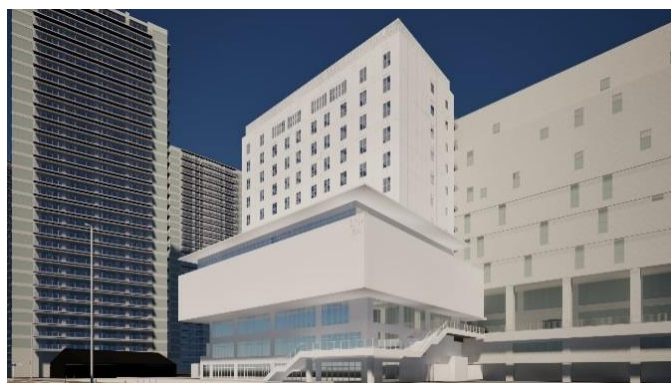
（仮称）ホテル温浴棟のイメージ

海老名市は、開発や住居供給、交通利便性の向上に加え、子育て支援に関する公的サービスが充実していることなどを背景に、同市の将来推計を上回る勢いで人口が増加しています。特に、0～4歳と30～44歳の人口が増加していることから、若いファミリー層の流入が多いものと考えます。