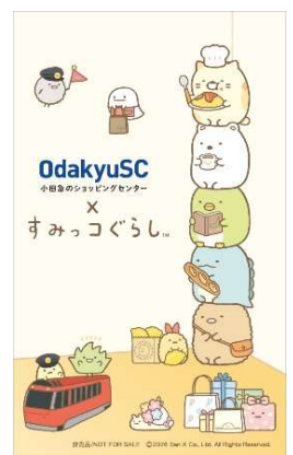
ステッカーイメージ

参加方法：対象の飲食店で1会計2,000円（税込）以上のご利用 & お会計時に 合い言葉「おかいものキャンペーン」と店舗スタッフにお伝えいただいた方に、 ステッカー1枚をプレゼントします。