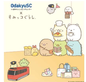
特大パネルイメージ

会場：① 新百合ヶ丘エルミロード：5Fエレベーターホール前 ② 本厚木ミロード：6Fレストランフロア