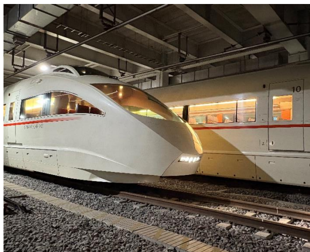
整備のため大野総合車両所へ向かうVSE(12月6日)

VSEは、2023年12月10日に最終運行、その後は当社の喜多見電車基地にて保管してきました。2025年12月6日未明には同基地を後にし、現在は展示という形で皆さまと再会できるよう、外装の完全塗り直しをはじめとした内外装のリフレッシュを実施中です。なお、一般展示開始日となる3月19日は、VSEの就役日(2005年)です。