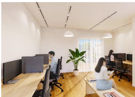
コワーキングスペース（イメージ）