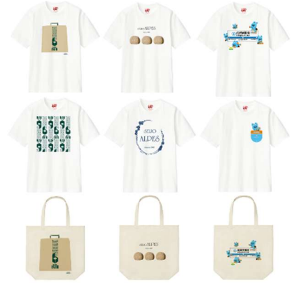
< 限定商品画像 (イメージ) >