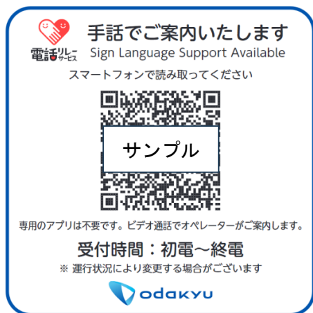
駅設置二次元コードイメージ

小田急電鉄株式会社（本社：東京都新宿区 社長：鈴木 滋）は、2026年4月16日（木）に、聴覚や発話に困難のあるお客さまとの円滑なコミュニケーションを実現するため、一般財団法人日本財団電話リレーサービスが提供する「手話リンク」を、小田急線16駅と、当社ホームページのお問い合わせ窓口へ導入します。今回の導入駅は、離れた場所にいる係員が、お客さまの状況を確認しながらご案内できる（カメラや遠隔操作可能な駅務機器等の設備が整った）駅を選定しており、ご利用状況を踏まえながら、導入駅を順次拡大していきます。なお、鉄道業界で初の取り組みです。