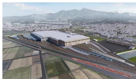
新たな総合車両所イメージ

現在、相模大野にある「大野総合車両所」で全車両の検査・修理を実施していますが、同施設は開設から60年以上が経過し、施設の老朽化に加え、一部の検査で10両編成に対応していないという課題があります。鉄道事業の安定的な継続と、鉄道車両検修体制のさらなる効率化・高度化を目的に、伊勢原～鶴巻温泉駅間に新たな総合車両所の整備を進めています。