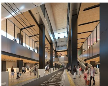
新宿駅完成後の地上ホームイメージ

また、鶴川駅と藤沢駅では、地元自治体と連携した自由通路整備事業にあわせて駅舎を橋上化し、まちの回遊性や利便性の向上を実現します。今年度は、各駅舎の建築工事を行うほか、藤沢駅ではホームと橋上駅舎をつなぐエスカレーターとエレベーターを供用開始します。