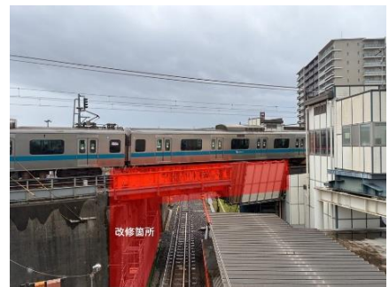
JR相模線跨線橋耐震補強工事箇所

激甚化する自然災害に備え、海老名～厚木駅間の「JR相模線跨線橋」や梅ヶ丘～登戸駅間の高架橋で耐震補強工事を進めるほか、読売ランド前駅、相武台前駅、座間駅、新松田駅でホーム上家の耐震補強工事を実施します。加えて、藤沢本町～藤沢駅間において、降雨や地震による被害を未然に防止するため、のり面改修工事を実施します。また、構造物の延命を図るため、継続的に行ってきた新松田～開成駅間の「酒匂川橋梁」での劣化した塗膜の塗り替え工事は、今年度完了します。