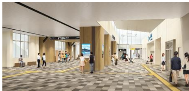
藤沢駅完成後の自由通路イメージ