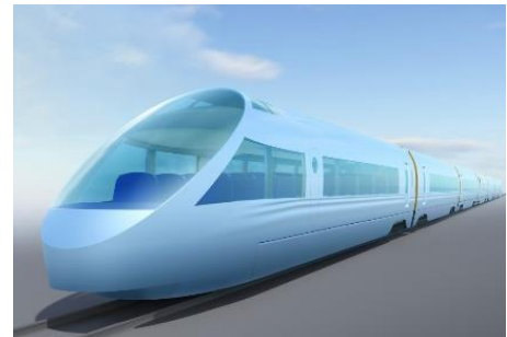
新型ロマンスカーイメージ

特急ロマンスカー・EXE（30000形）の代替であり、VSE（50000形）の後継と位置付ける新型ロマンスカー（80000形）は、2029年3月の就役に向け、詳細設計を実施します。将来にわたるお客さまニーズを追求しながら、沿線の自然豊かな風景との調和や、多様な利用シーンに応える上質な乗車体験の実現を目指します。