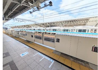
ホームドア（写真は喜多見駅）

お客様のホームからの転落や列車との接触事故を防止するため、「鉄道駅バリアフリー料金制度」や東京都の「ホームドア整備加速緊急対策事業」による補助金などを活用し、今年度中に経堂駅、和泉多摩川駅の全ホームでホームドアの供用を開始します。