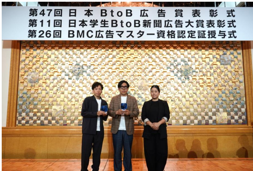
第47回 2026 日本BtoB広告賞 表彰式

(参考)KATARITSUGI特設ウェブサイト: https://www.odakyu-chukai.com/kataritsugi/