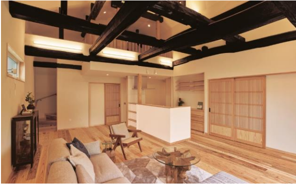
最高天井高5m超・浮造り床が心地よいリビング