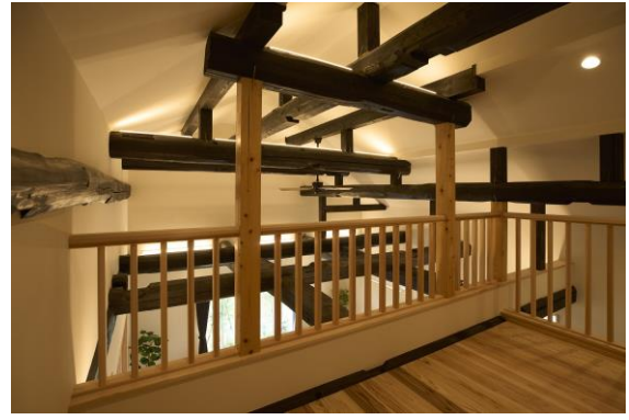
古材にふれることができるロフト