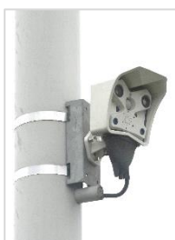
安全確認用カメラ

※ レーザー光を照射し、その光が遮られることで、踏切内の異常を検知するための装置