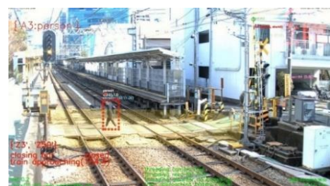
AIが踏切内の歩行者を検知している様子 (イメージ)