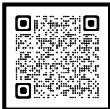
Google Play 版