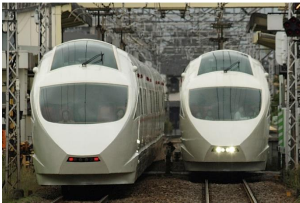
特急ロマンスカー・VSE（50000形）

小田急電鉄株式会社（本社：東京都新宿区 社長：星野 晃司）は、“白いロマンスカー”として多くのお客さまにご愛顧いただきありがとうございました特急ロマンスカー・VSE（50000形）について、2023年12月10日（日）のイベント運行（最終到着地：成城学園前駅）をもって完全引退することを決定しましたのでお知らせします。（VSEは、Vault Super Express、Vaultはドーム型の天井、天空の意から名付けました）