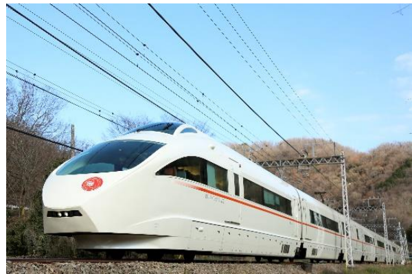
ニューイヤーエクスプレスとして運行する様子

バブル経済の崩壊により、世界に誇る観光地「箱根」も全国の観光地と同様にお客さまが減少する中、箱根への観光輸送に特化したロマンスカーとして、復興の想いを込めて2005年にデビューさせたのがVSEでした。移動時間をより上質なものとするため、空間設計等を意図して建築事務所「岡部憲明アーキテクチャーネットワーク」に総合デザインを依頼し、高いドーム型天井や温かみのある木を用いるなど居住性を高める革新性と、展望席や接続台車など伝統も継承した車両です。2005年3月19日午前9時に新宿－箱根湯本間を最速で結ぶ「スーパーはこね」として営業運転を開始以来、新年を祝い初詣や初日の出としてご利用いただける「ニューイヤーエクスプレス」などさまざまなシーンで当社の顔を飾ってまいりましたが、特殊な構造や装置を採用していることからVSE本来の性能を維持して運行することが困難であり、約18年の年月に幕を下ろします。