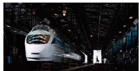
VSEスペシャルフォトカード