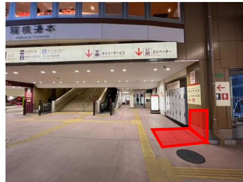
新設するオンライン専用窓口設置場所イメージ