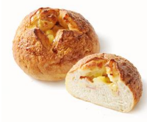
おしょうゆチーズフランス