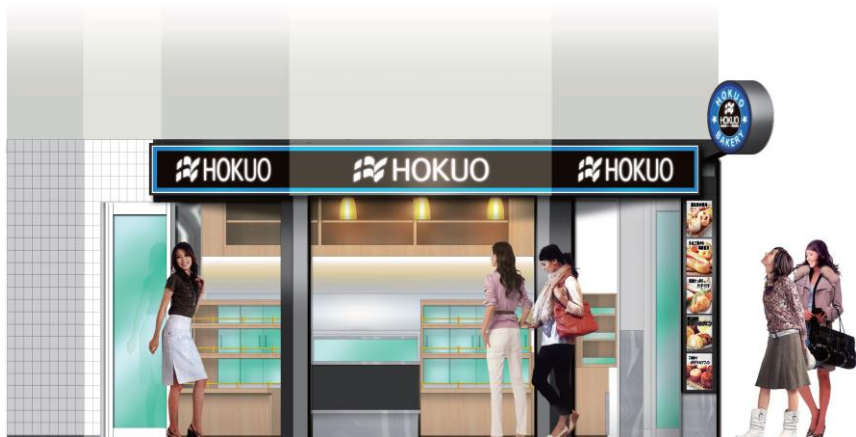
綱島店（東急東横線）店舗（イメージ）

ベーカリーショップ「HOKUO」は、小田急線沿線を中心に店舗を展開しており、近年では首都圏エリアにその事業エリアを拡大しております。今後も、お客さまに身近な駅前のベーカリーとして、「安全・安心・健康・美味」をテーマに、おいしいパンを提供してまいります。