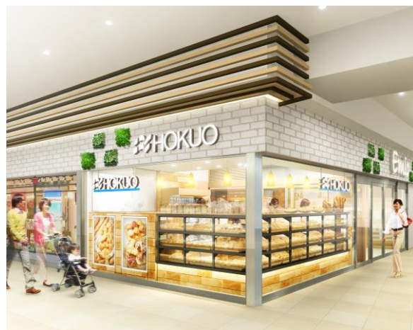
新所沢店（西武新宿線）店舗（イメージ）