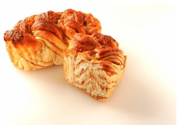
メープルボックス

※ オープン記念セール対象商品については、いずれも他の割引券や優待制度との併用はできません