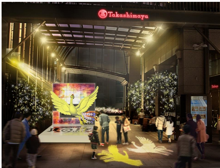
『HINOTORI イルミネーション』※画像はイメージです。