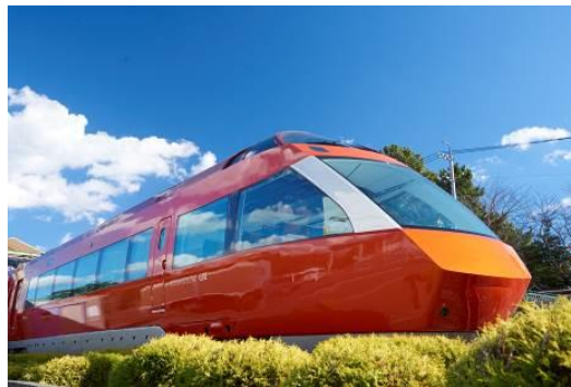
新型ロマンスカー・GSE（70000形）