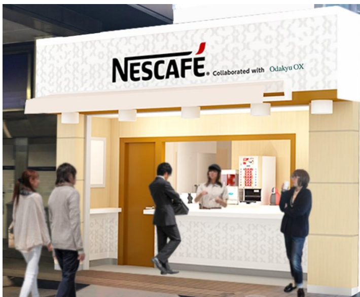
「ネスカフェ スタンド 小田急玉川学園前店」 （イメージ）