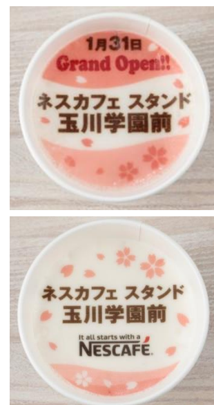
「ネスカフェ オリジナルラテアート メニュー」 （イメージ）