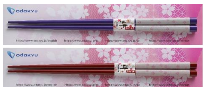
桜柄のお箸（イメージ）