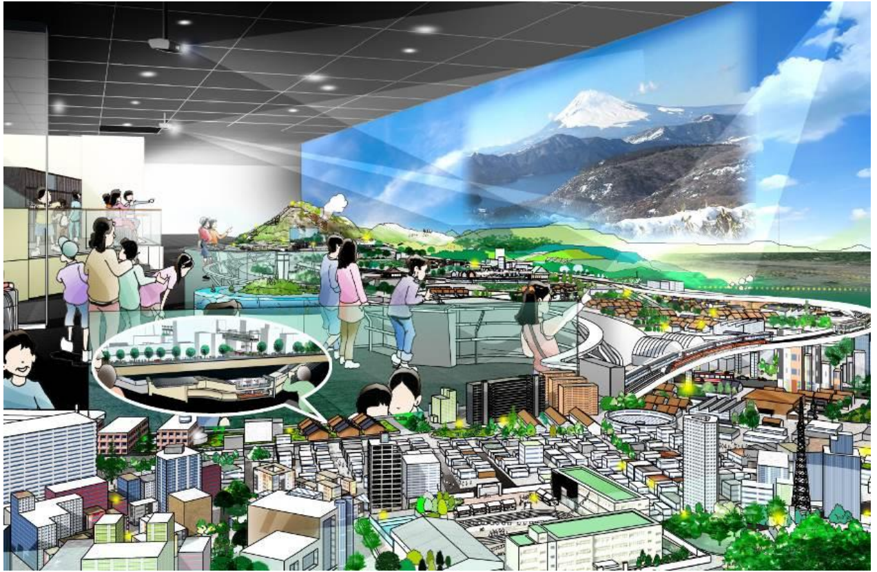
ジオラマイメージ