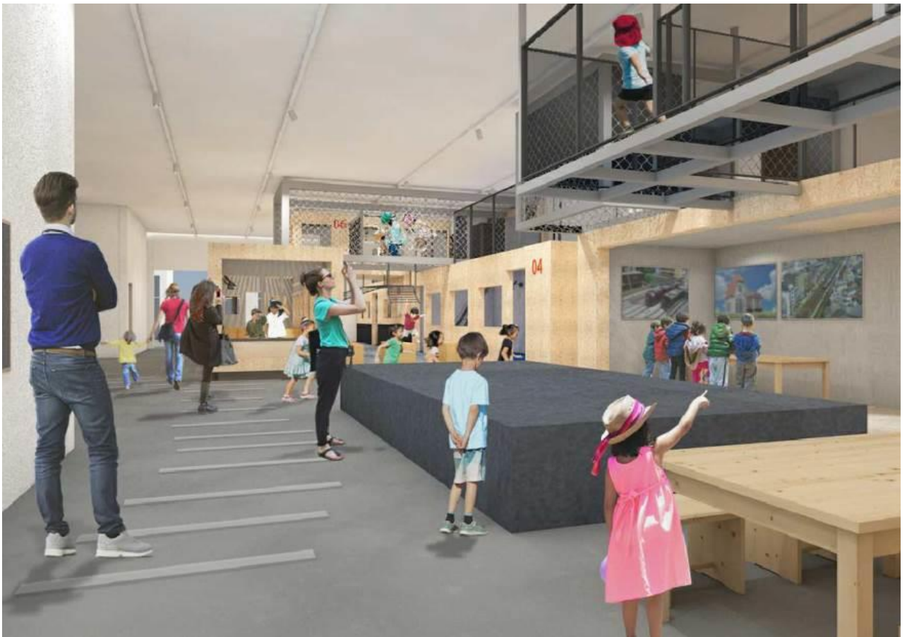
キッズゾーンイメージ