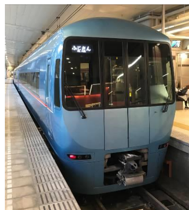
「ふじさん号」に使用する「特急ロマンスカー・MSE（60000形）」

★「ふじさん号・(英語名) Mt. Fuji」の臨時列車について（駿河小山には停車しません）