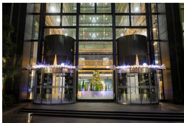
新宿マインズタワー