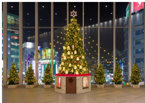
JR 新宿ミライナタワー