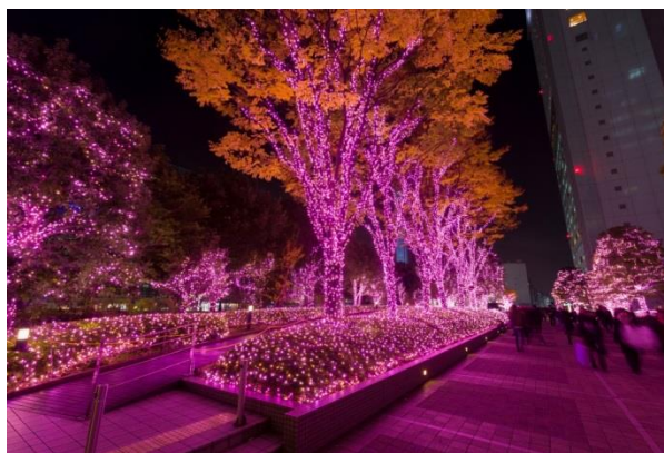
新宿サザンテラス