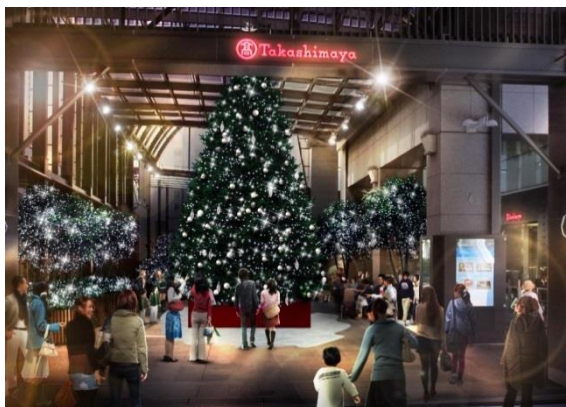
タカシマヤ タイムズスクエア