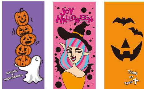
< 2階 >