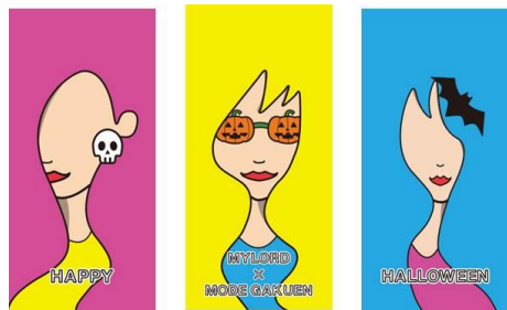
< 1階 >