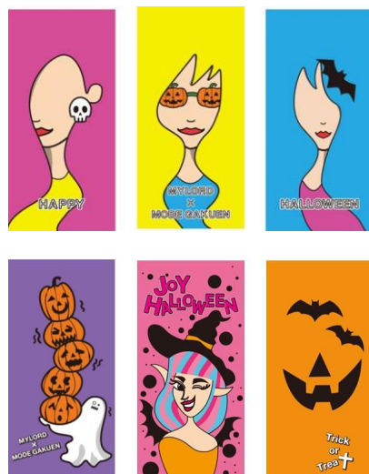
エレベーター装飾イメージ（上段1階、下段2階）