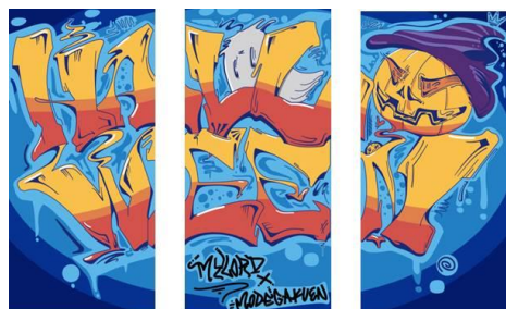
< 3階 >