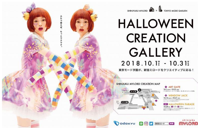
ビジュアルデザイン（イメージ）

この秋は、ハロウィン装飾でクリエイティブに彩られた新宿ミロードでお買い物をお楽しみください。