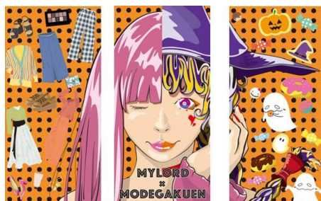
< 4階 >