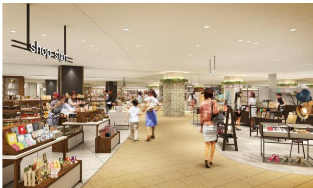
A館4階 館内イメージ（エスカレーター正面より）

相模大野駅改札階の直上となるA館4階は、全面改装し、新たにコスメを豊富に取り揃えた「hands be」とプチプライス雑貨から家具まで幅広く取り揃える「AWESOME STORE」が出店します。また、「カフェ・ド・クリエ」やシンボルツリーのまわりでゆったりくつろげるレストスペースを新設するなど、駅を行き交う方々が気軽に立ち寄れる賑わいのフロアへと生まれ変わります。