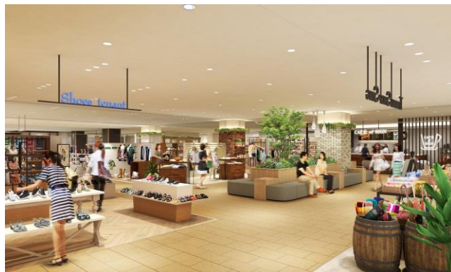
レストスペースのシンボルツリー（イメージ）