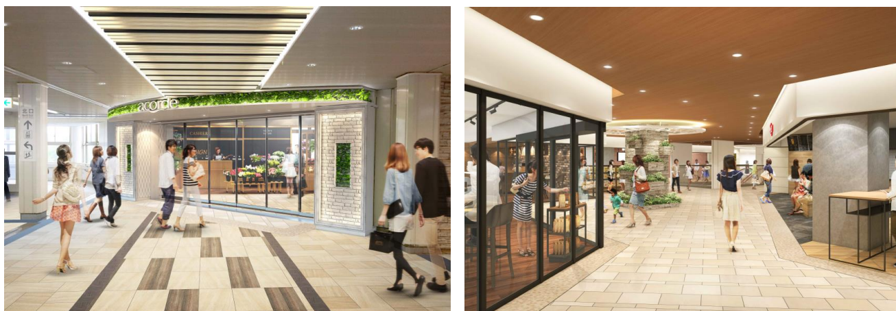
小田急アコルデ新百合ヶ丘北館3階駅コンコース店舗入口（左）、店内（右）イメージ

ますます便利で魅力的に生まれ変わる「小田急アコルデ新百合ヶ丘北館」に是非お越しください。