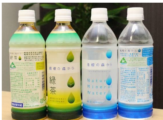
箱根の森から緑茶（左）と箱根の森から（右）