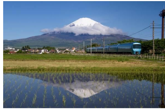
「ふじさん号」に使用する「特急ロマンスカー・MSE（60000形）」

「冬の臨時特急ロマンスカー・ふじさん号（英語名：Mt. Fuji）」の詳細は以下のとおりです。