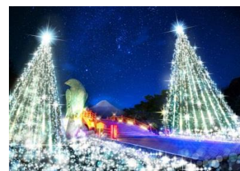
(イルミネーションイメージ)

場所 静岡県御殿場市神山719 期間 2018年10月27日(土)~2019年3月17日(日) 点灯時間 16:30~22:00 (時期により変更) テーマ 「150メートル 虹色の噴水 go!」 詳細はホームページ http://www.tokinosumika.com/ お問い合わせ 0550-87-3700 (インフォメーションセンター) ※ お問い合わせ時間 9:00~20:00