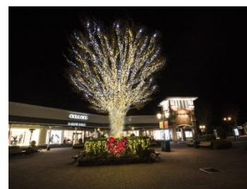
(イルミネーションイメージ)

場所 静岡県御殿場市深沢1312 期間 2018年11月2日(金)~2019年2月20日(水) 点灯時間 日没~20:00 (※12月~2月は19:00まで) テーマ 「“Flower Carnival”」 詳細はホームページ https://www.premiumoutlets.co.jp/gotemba/ お問い合わせ 0550-81-3122 (インフォメーション) ※ お問い合わせ時間 (3月~11月) 10:00~20:00 (12月~2月) 10:00~19:00