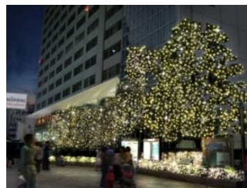
新宿サザンテラス