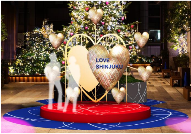
タカシマヤ タイムズスクエア

新宿サザンテラスでは、ビッグフラワーが咲き誇る「ビッグフラワーパーク」を実施いたします。大きな花の中に座ってカラフルな周囲の花々に囲まれながら、写真をお撮りいただけます。タカシマヤ タイムズスクエアでは、「Heartシリーズ」を製作し続けるアーティスト・西村公一氏監修の“ハート”をモチーフにしたオブジェが登場いたします。Suicaのペンギン広場では、シャンデリアで飾ったSuicaのペンギン像や、リングの重なりをイメージしたシンボルトゥリーなど、SNS映えるスポットをお楽しみいただけます。