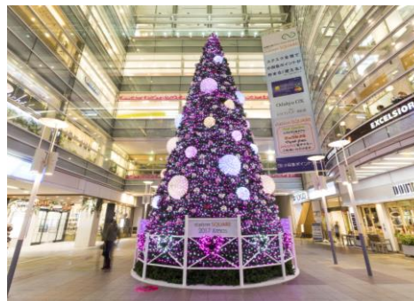
クリスマスツリー（昨年の様子）

高さ12mのクリスマスツリーで彩られたアトリウム広場の会場では、公益社団法人相模原市シルバー人材センターの協力を得て、クリスマスにちなんだオーナメントづくりのワークショップを開催するなど、地域の皆さまや活動団体との親和性の高い企画となっています。