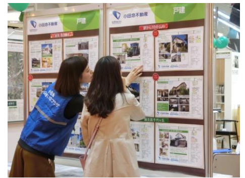
これまでに開催したフェアの様子

今回はそのような場として、神奈川県央エリア 1 で乗降者数13万人 2 を超える一大ターミナル駅である小田急線「相模大野駅」直結の大型商業施設小田急相模大野ステーションスクエアにて、初めて開催します。