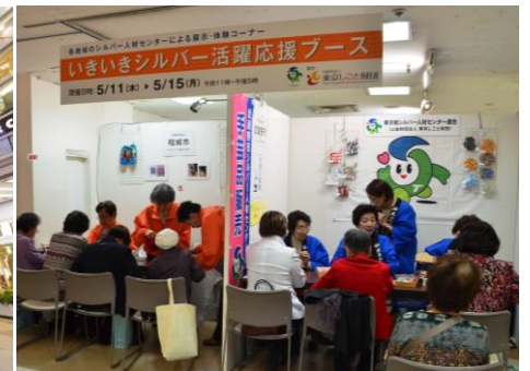
これまでのワークショップの様子