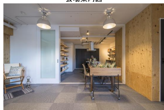
リノベーションマンション モデルルーム