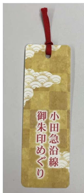
オリジナルしおり(イメージ)