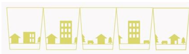
「クリスマスの街並み」をテーマとした キャンドルホルダーラッピング装飾（イメージ）