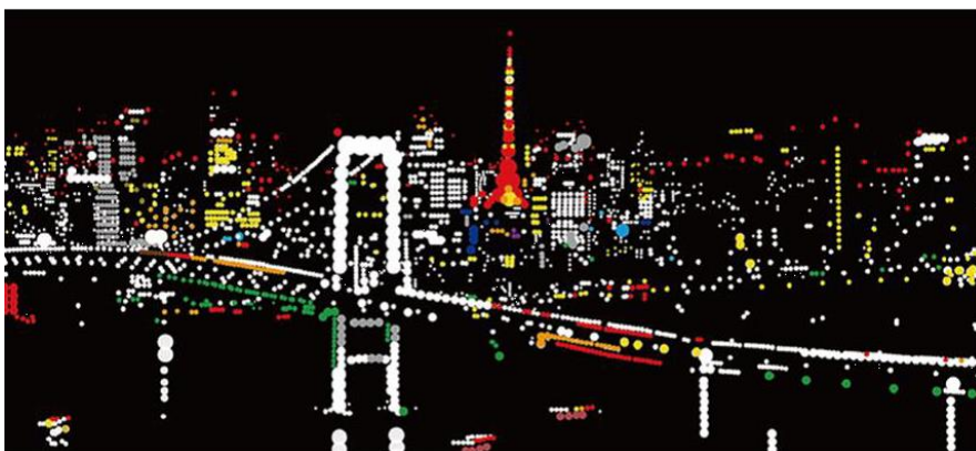
シールアートイメージ