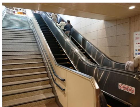
工事完了し稼働中の本厚木駅上りホーム(新宿方面) 上下エスカレーター