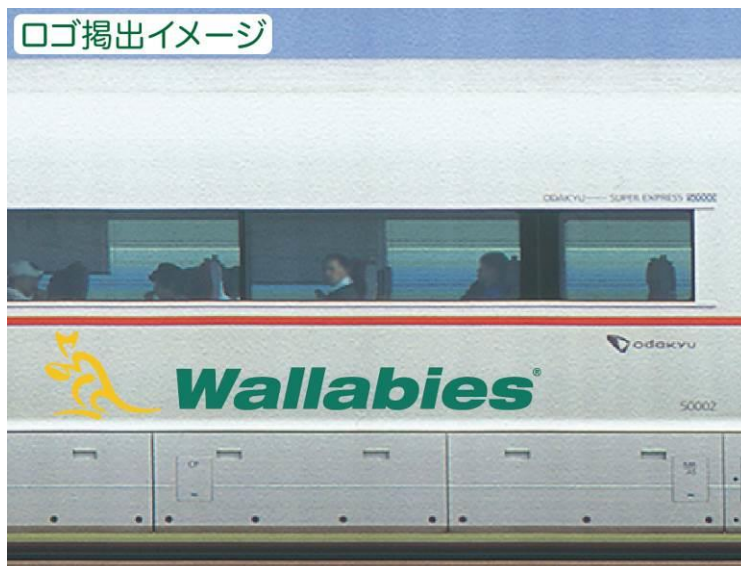
特急ロマンスカーの装飾（イメージ）