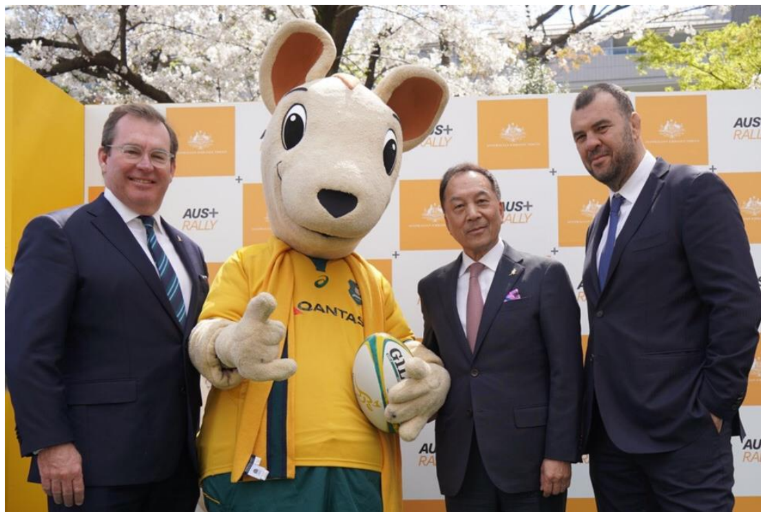
ラグビーオーストラリアCCO キャメロン・マリー氏（左） 小田急電鉄 取締役社長 星野 晃司（中央） ラグビーオーストラリア代表監督 マイケル・チェイカ氏（右）

今後は、両者が連携し、ワラビーズの応援を目的とした広告展開や、多くのサポーターが訪れる新宿やキャンプ地である小田原を中心にイベントを実施する予定です。また、ワラビーズとのコラボレーションにより作成した箱根PR動画を海外にも積極的に配信していくなど、スポーツや交流を通じた沿線エリアの活性化を目指してまいります。