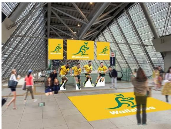
小田原駅の装飾（イメージ）