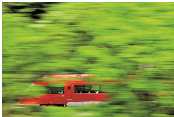
「小田急ロマンスカー カレンダー 2019」表紙 タイトル「新緑を駆けるGSE」

「小田急ロマンスカー カレンダー 2020」掲載フォト作品募集の概要は下記のとおりです。