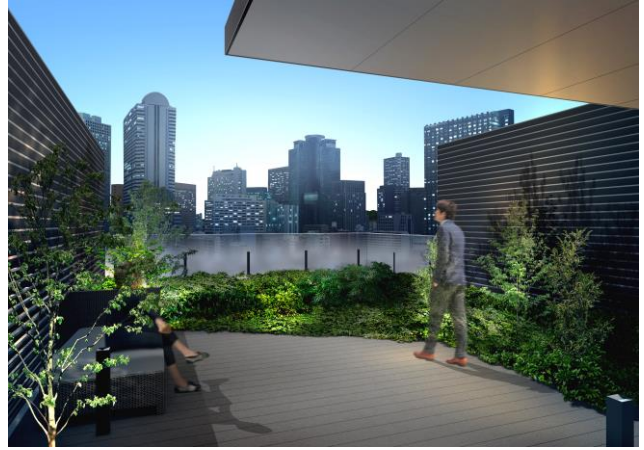
左<事務室完成予想図> 右<テラス完成予想図>