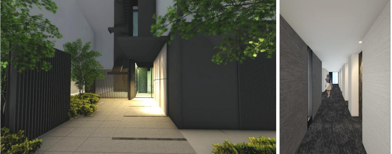
左<住居専用エントランス完成予想図> 右<内廊下完成予想図>

9階から11階のレジデンス部分（総戸数30戸）は、職住近接のライフスタイルを志向するアクティブな単身者を想定し、1Kの間取りを中心にプランニングしました。住宅フロアを上層階に配置し、かつ内廊下とすることで、都心の喧騒から逃れ、安らぎある居住空間を実現するとともに、新宿の眺望を望むことが可能です。また、特に見晴らしの良い住戸（Aタイプ・Eタイプ）については、それぞれ1LDK・2LDKと広めのプランとすることで、プレミアム感を演出しました。