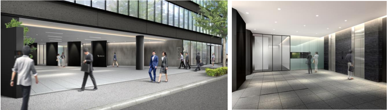
〈オフィスエントランス完成予想図〉（左：外部 右：内部）

時代の流行を色濃く反映する都市「新宿」において、モノトーンをベースとしたスタイリッシュな空間を追求し、トレンドに左右されないデザインの建物を目指しました。シンプルな構成の中に自然の素材感や時を経た質感を加える事で、空間に豊かさをもたらします。