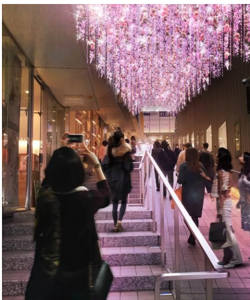
咲き乱れる花をイメージしたイルミネーション (イメージ)

「colors」をテーマに、新宿駅西口から南口にかけてエリアごとに異なる5色のイルミネーションと花装飾を施し、新宿テラスシティを彩ります。加えて、新宿テラスシティ内に全4カ所のフラワーリースによるフォトスポットを設置し、写真撮影をお楽しみいただけます。