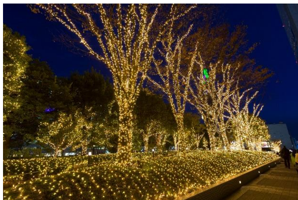
新宿サザンテラス