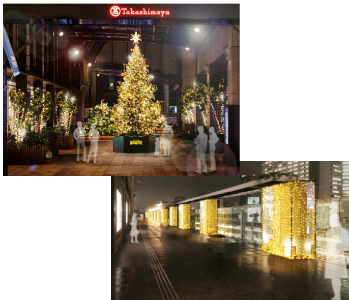
タカシマヤ タイムズスクエア