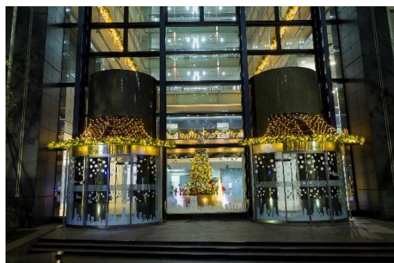
新宿メインズタワー