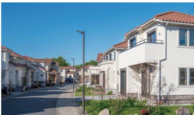
<リーフィア町田小山ヶ丘>