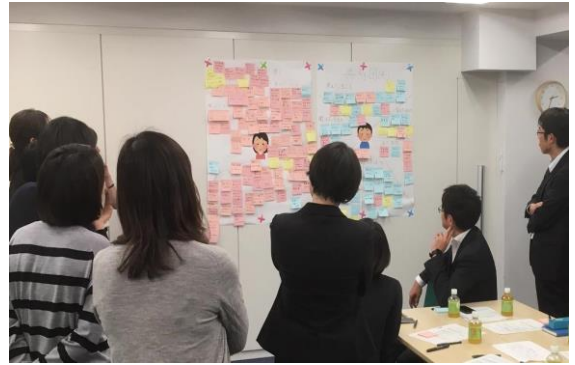
<ワークショップ風景>

現在当社では、「IDEA20」を採用した住宅の開発に着手し、今冬に販売を予定しています。