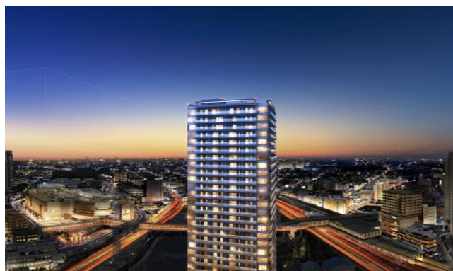
<リーフィアタワー海老名アクロスコート>