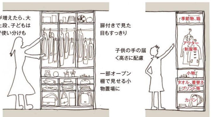
■個人ロッカー展開図