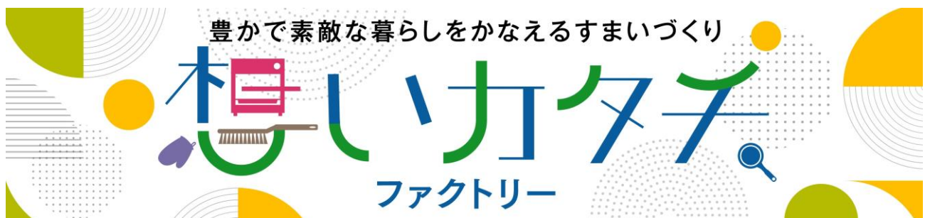
<「思いカタチ. ファクトリー」バナー広告>

当社では今後も、お客さまの声に寄り添いながら「思いカタチ. ファクトリー」が生み出す新たな住まいの開発を進めてまいります。