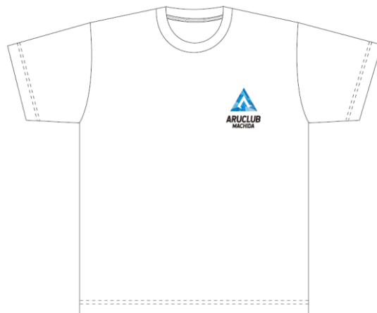
オリジナルTシャツイメージ