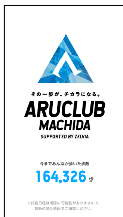
アプリ画面イメージ

歩いて試合会場に向かうお客さまを増やすことで、アプリユーザー同士の新たな交流機会や、まちの魅力を再発見する機会を創出するだけでなく、健康も増進します。また、町田市が抱える課題の1つである鶴川駅前の交通渋滞の緩和に加え、CO 2 排出量削減など、社会課題の解決へ向けたアプローチから地域活性化を図ります。