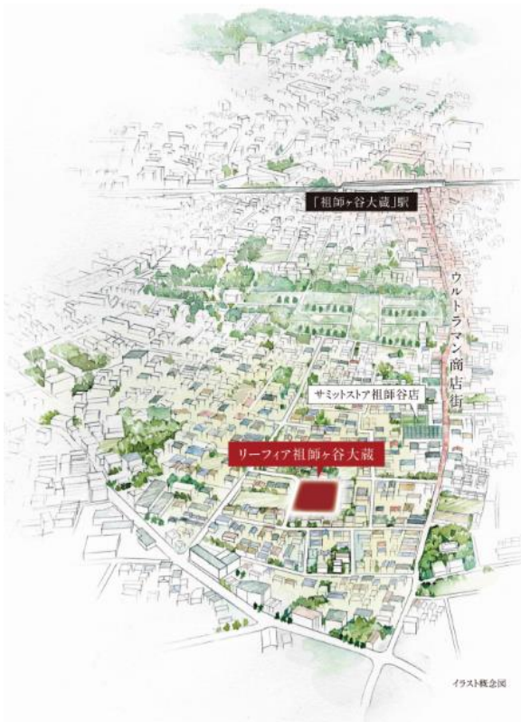
<周辺エリアイラスト>

本物件は、ウルトラマン商店街から程近い閑静な住宅街にある約2,400㎡の敷地を開発して誕生します。「悠久の邸宅」をコンセプトにモダンでスタイリッシュなデザインを採用し、建物の外観には切石素材やタイルを使って重厚感を演出しています。外構には大型の門扉やコーナーウォールを組み合わせ、立体感を感じさせるプライバシー性の高いセミクローズ外構を取り入れました。また、デザイン性の高いインターロッキング舗装の開発道路に連続したデザインを取り入れたカーポートを組み合わせ、1邸1邸が美しく調和し洗練された街並みを創出しました。