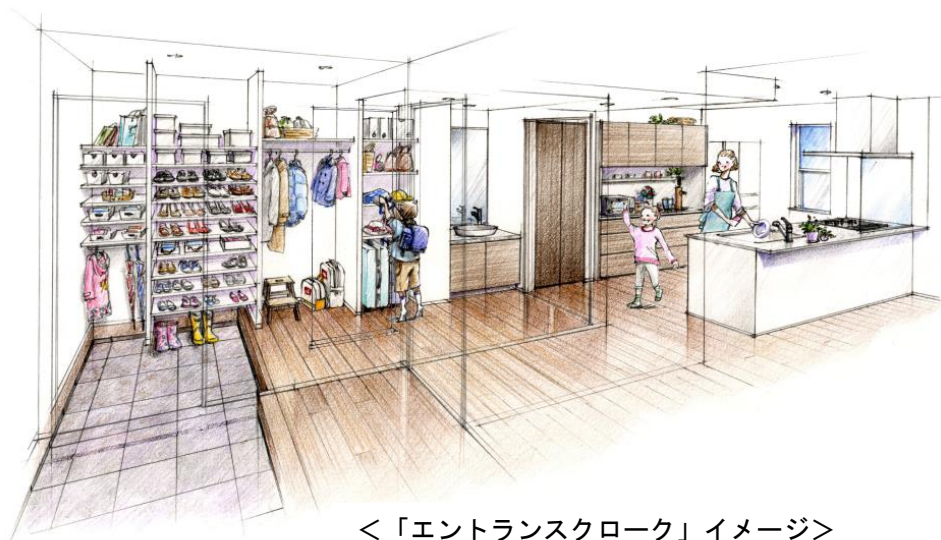
<「エントランスクローク」イメージ>

本物件は、「くつろぎのイエジカン」をテーマに、家事の時間を短縮する「イクカジスタイル」、共働きママ向けの「スマジヨスタイル」、パパが趣味を満喫できる「パパ充スタイル」の3つのライフスタイルを、共働きファミリーのための20項目の新発想空間「IDEA20」の要素を組み合わせ提案しています。