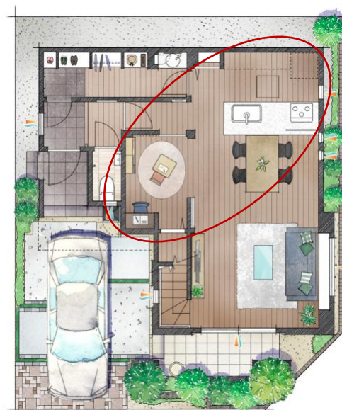
<「家族コーナー」を採用したプラン>

「スマジヨスタイル」や「パパ充スタイル」の詳しい内容は順次、公式ホームページにて紹介していきます。