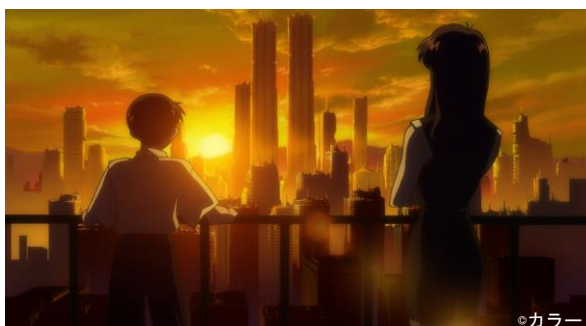
物語の舞台となる第3新東京市の夕景