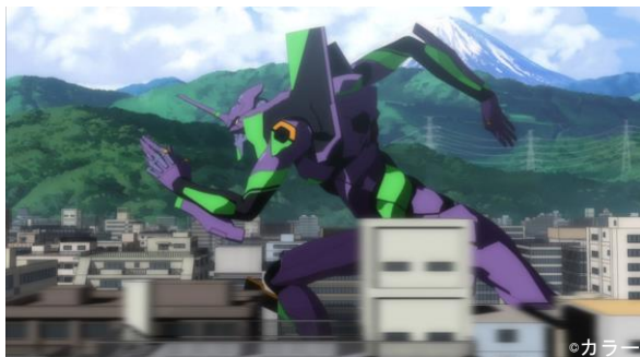
疾走するエヴァンゲリオン「初号機」