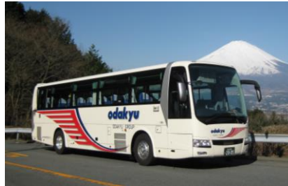
小田急箱根高速バス