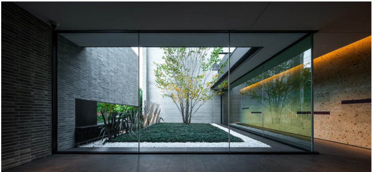
＜エントランスホールから中庭を望む＞

成城の街の言語である「庭」性を丁寧に読み解くことから始めた設計姿勢を高く評価したい。具体的には、集合住宅の外部アプローチを豊かにするだけでなく、コの字状の平面計画とし、内部廊下にまで大谷石の仕上げを用いることで、内部のシーケンスにまで「庭」性を引き込み、街と集合住宅とが連続的な計画となり、街の社会資本を形成する良質なデザインとなっている。