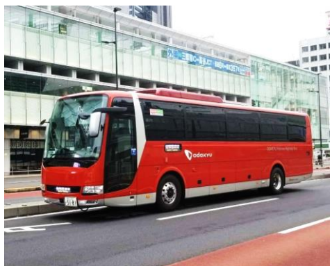
小田急箱根高速バス(GSEカラー)

小田急グループでは、御殿場における観光の魅力の向上とともに、御殿場・箱根エリアの回遊性を高めることで、一大広域観光リゾートエリアの実現を目指します。