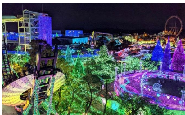
よみうりランド「ジュエルミネーション®」 (今シーズンの様子)