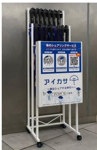
アイカサ専用傘立て（イメージ）

シェア傘の利用促進は、傘の持ち歩きの手間からの解放とともにビニール傘の使い捨て削減につながります。駅前をはじめとした街の美観を保つほか、SDGsの目標12「持続可能な消費と生産のパターンを確保する」に適った、廃棄物の削減にも寄与するため、2019年度内に小田急線内全駅への設置を目指します。