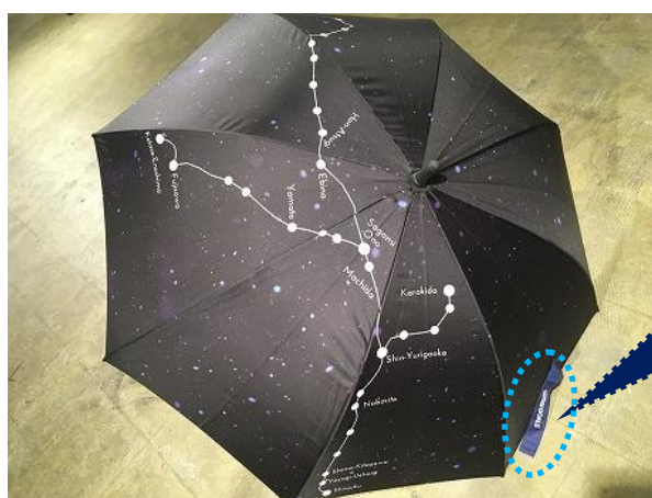
オリジナルデザイン傘