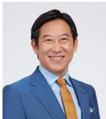
スポーツ庁長官：鈴木 大地氏

本イベントは、スポーツ庁が国民のスポーツ実施率向上のために国が実施すべき事業プランを公募する「第2回パブコン※～もしも私がスポーツ庁長官だったら～」で、経済産業省の紺野春菜氏が最優秀賞を受賞した「ふとももすっきりプロジェクト」を実現する第一弾企画です。