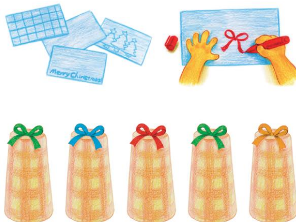
塗り絵と装飾したキャンドルのイメージ