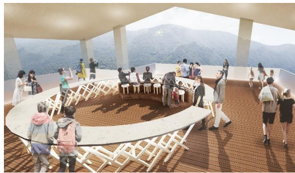
展望デッキ、足湯(イメージ)