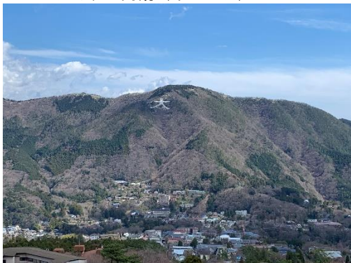
展望デッキからは、箱根外輪山を一望