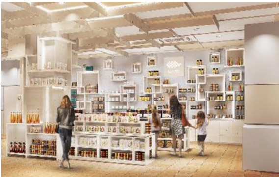
ショップ内観(イメージ)