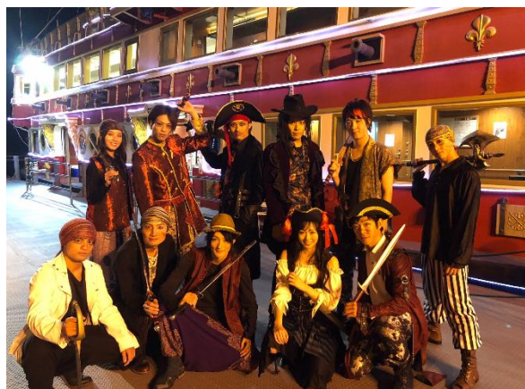
「箱根芦ノ湖 Pirates of Sunset Cruise」