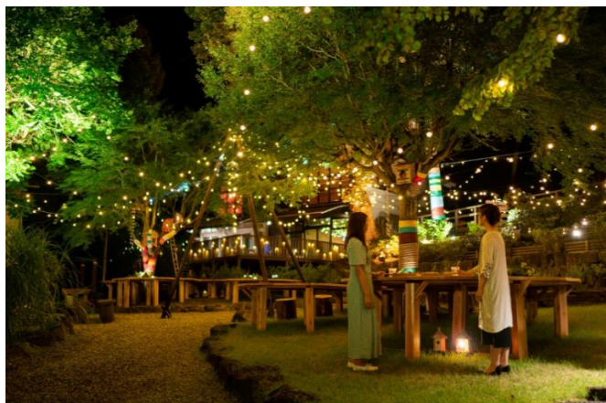
「箱根湯本 Summer Night Village」